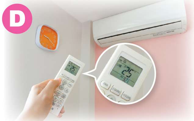
把冷氣溫度調至近 25.5°C