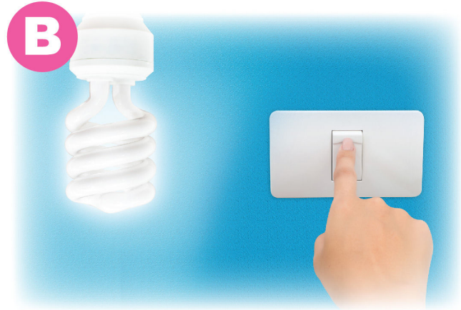
關掉不需要使用的電燈