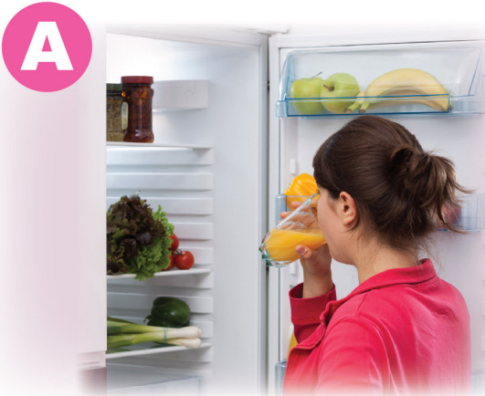
長時間打開雪櫃門