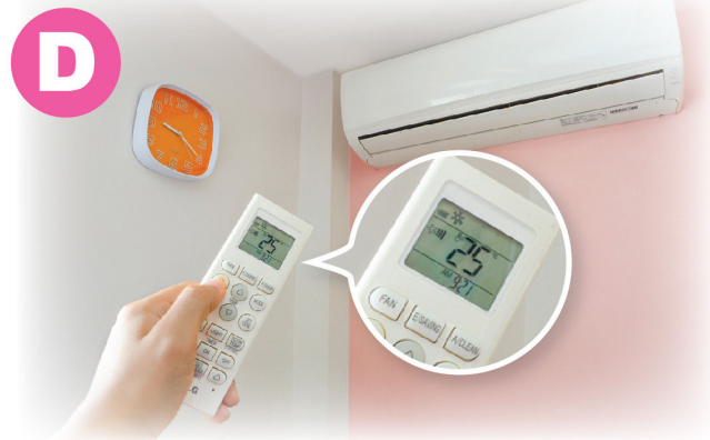
把冷氣溫度調至近 25.5°C