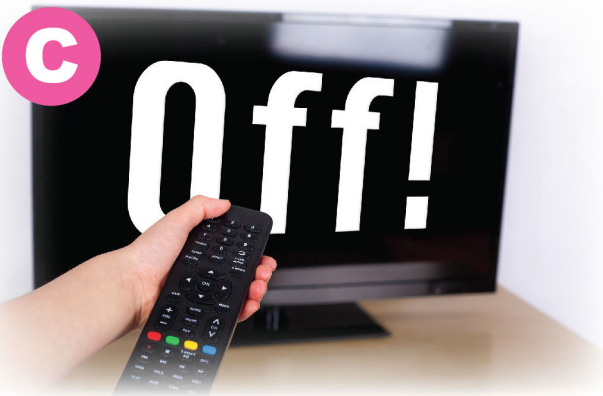
關掉不需要使用的電視